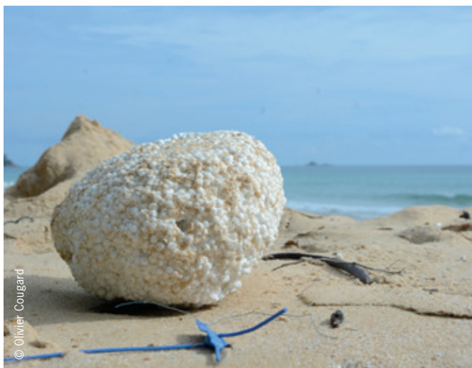
La plage de Naithon sur l'île de Phuket en Thaïlande est parsemée de débris en plastique.